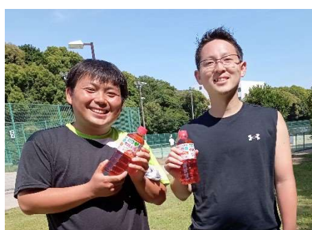
4位: 平野・池谷 (HTA)