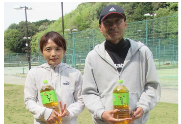
3位: 増田・増田(初生クラブ)