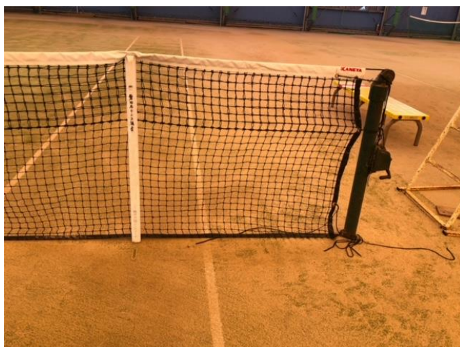
シングルススティックの中心を合わせて垂直に立てる